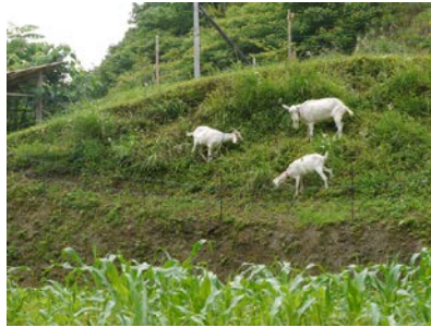
傾斜地でのヤギ放牧