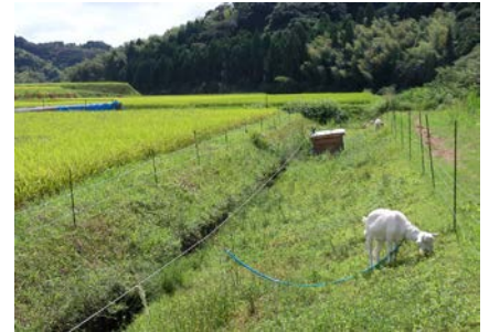
水田畦畔でのヤギの繋牧