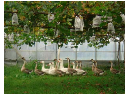
ブドウ園でのガチョウ放飼